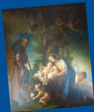
Chiesa parrocchiale Verdellino RIPOSO NELLA FUGA IN EGITTO Cignaroli Gian Bettino 1706 - 1770 dipinto tra il 1740 e il 1760

Notiziario delle Parrocchie di S. Ambrogio V. e D. in Verdellino e di Maria Madre della Chiesa in Zingonia dicembre 2022